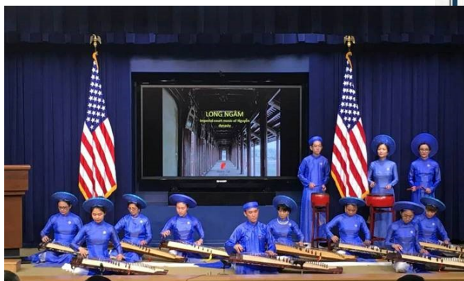
Huong Viet performance at the White House 2018